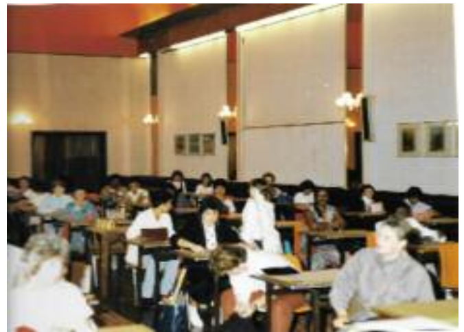
examens in Krasnapolski

Manufacturing behaald. Evenals couture tekenen en moulage. ‘Rundschau’ was het eerste systeem dat patroontekenen op de computer uitbracht. Ook studeerde ik Textiele werkvormen aan de Bouman Academie. Lange tijd vervaardigde ik patronen voor bekende couturiers en ik specialiseerde mij in bruidskleding – ik bezit ook het predikaat Bruids- en Avondkleding van de Bond van Kleermakers, waarvan ik bestuurslid was. Bij verscheidene couturiers heb ik mij theoretisch en praktisch bekwaamd.’