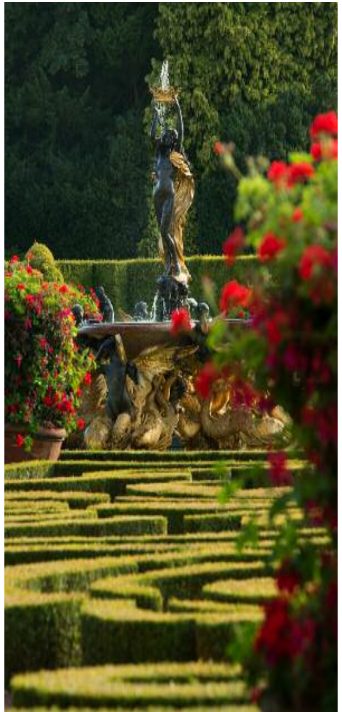
De Mermaid Fountain in de Italiaanse tuin van Blenheim Palace, Oxfordshire

viteiten in het kader van het Jaar van de Engelse tuin op www.visitbritain.org of www.visitengland.com