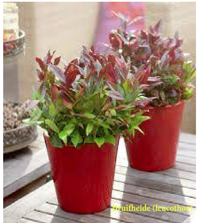
Druifheide ( Leucothoe )

De dagen worden steeds korter en donkerder, planten zijn uitgebloeid, de bomen kaal. Je zou er depressief van worden. Gelukkig zijn er planten en struikjes die wintergroen zijn, kleurige bessen dragen of zelfs bloeien in de winter. Vul potten en bakken bijvoorbeeld met Skimmia , winterviolen, heide (als je daarvan houdt), bergthee ( Gaultheria ), kerstrozen ( Helleborus ), parelbes ( Pernettya ), klimop en zilverstruikjes ( Calocephalus ). In de geveltuin kun je blauw schapengras ( Festuca glauca ), druifheide ( Leucothoe ), toverhazelaar ( Hamamelis ), dwerg- of glansmispel ( Cotoneaster ), hulst, winterjasmijn, sneeuwbal ( Viburnum ) of een mahoniestruik planten.