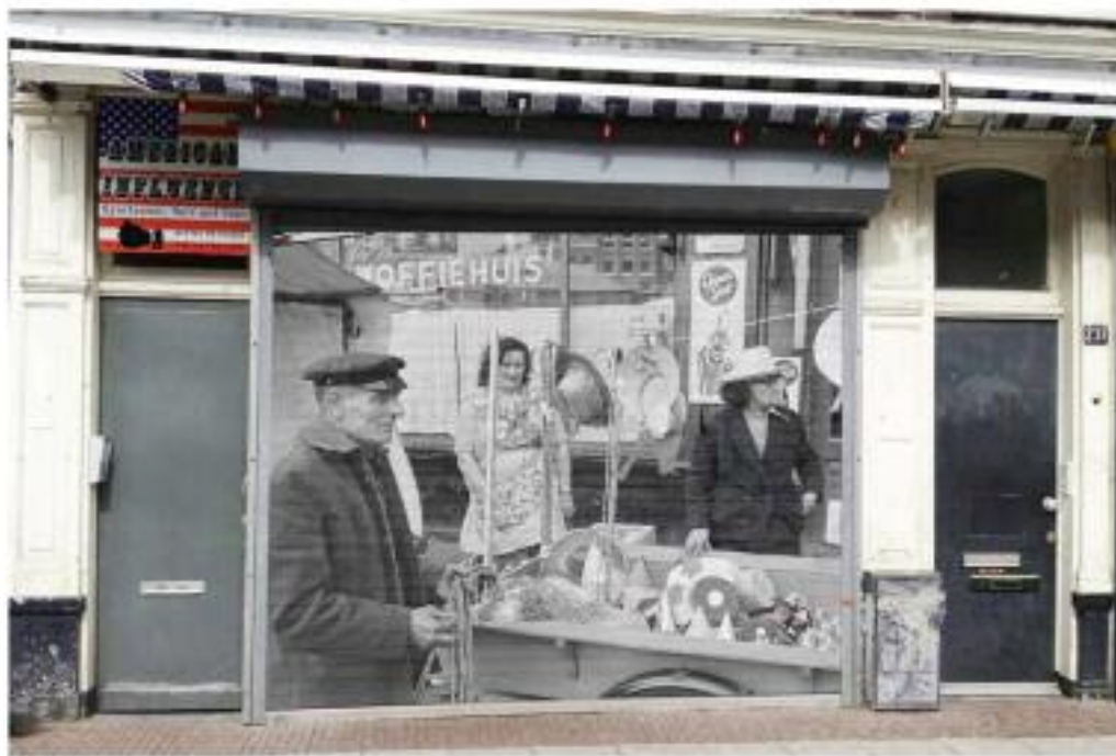
zo zou het ook kunnen