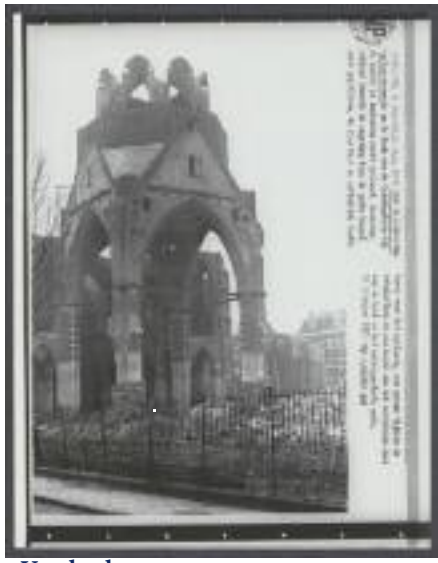
Van kerk naar woon- en zorgcentrum - en nu?

Momenteel is er veel te doen over de sluiting van verschillende instellingen van Amsta. Ik zit gelukkig niet in politiek, want dan had ik al tig mensen iets willen aandoen, onder wie bankdirecteuren en managers. Ik maak altijd wel een rustige indruk, maar als ik dit soort dingen lees dan wordt het rood voor mijn ogen. Vandaar dat ik maar een heel kleine tv heb. Ik kan er slecht tegen en beperk me meestal tot leuke fantasy- of science fiction-films.