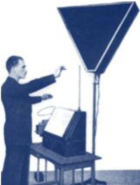
Lev Termen met eigen instrument met luidspreker, ca 1927.

De theremin ziet eruit als een kastje met twee antennes. Het grappige is dat je helemaal niet aan het kastje zit met je handen, maar het als een soort dirigent van een afstandje bespeelt. Rond de antennes zitten elektronische velden en de bespeler (de thereminist) beweegt zijn handen in die velden en kan daarmee de toonhoogte en luidheid van het instrument beïnvloeden. De juiste toonhoogte te treffen is best lastig, je moet er absoluut een goed gehoor voor hebben.