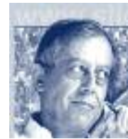
Filosofische en spirituele uiteenzetting van de Humanistische Beweging. Auteur: Silo

vervolg van 199 Terugblik op wat al gezegd is in De Aarde Menselijk maken . uit HET MENSELIJKE LANDSCHAP Hoofdstuk 10 De wet