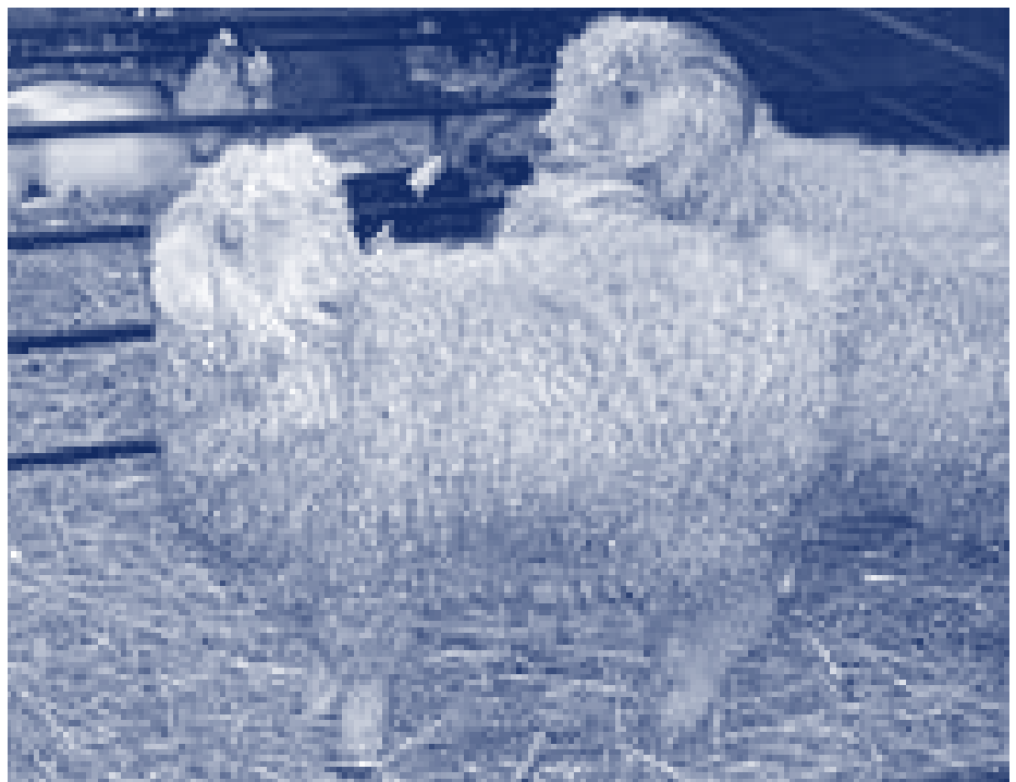
Angoraschape bij de publieke waterput