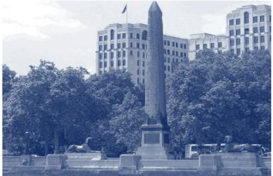
Naald van Cleopatra in Londen

Cleopatra stamde uit het Grieks - Macedonische huis van de Ptolemeus dynastie, ze leefde van 69 tot 30 voor Christus en ze was Farao van Egypte. Om een Romeinse overheersing te voorkomen werd ze de minnares van Caesar van wie ze een zoon kreeg waarna ze met hem huwde. Toen Caesar vermoord werd kreeg ze een relatie met Marcus Antonius van wie ze eerst een tweeling kreeg, een zoon en een dochter en later nog een zoon en ze is met hem getrouwd. In de oorlog tegen de Romeinen, waarin ze aan de verliezende hand waren pleegden beiden zelfmoord. Haar levensverhaal is verschillende keren op film gezet en in de bioscopen gedraaid, de eerste keer was dat in 1899. De meest spraakmakende was die in 1963 met Rex Harrison als Caesar, Elizabeth Taylor als Cleopatra en Richard Burton als Marcus Antonius. Liz Taylor en Richard Burton leefden