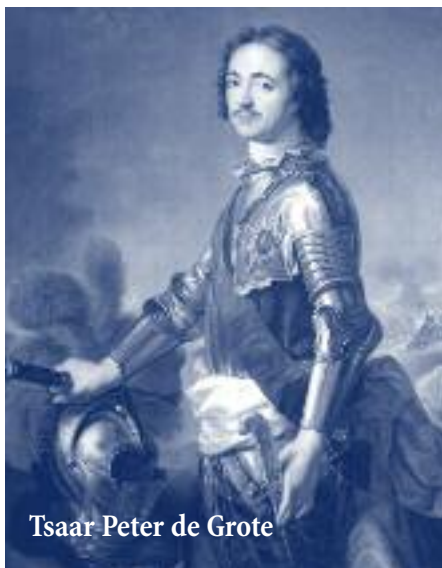
Tsaar Peter de Grote

Tsaar Peter de Grote, die in Zaandam de Hollandse scheepsbouw bestudeerde, heeft de Hortus vier keer bezocht. In 1717 was hij er samen met zijn vrouw Catharina. Uit de briefwisseling die over dat bezoek terug te vinden is, komt niet bepaald een fijn beeld van hem naar voren: lomp en onbehouwen, roggelend en spugend op het tapijt. Over de tsarina was men wel te spreken; ze had aardig wat plantenkennis en ze vermaakte zich kostelijk met het kruidje-roer-me-niet.