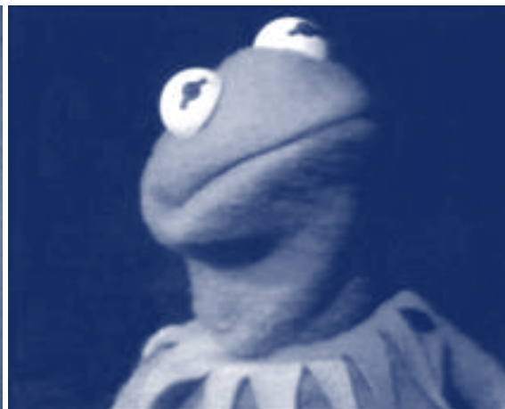
Kermit de Kikker

Dank voor de vele onverwachte en leuke vondsten. Hieruit heb ik een nieuwe canon samengesteld, dus nu van de lezers. Daar heb ik zelf, lekker democratisch, een Top Tien uit samengesteld.