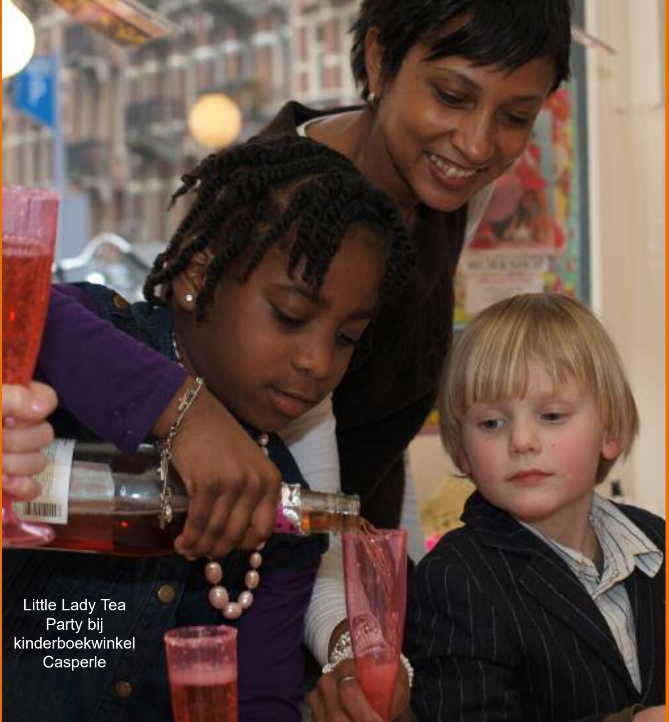
Little Lady Tea Party bij kinderboekwinkel Casperle

De historie van de Hortus (III) zie pagina 8 en 9