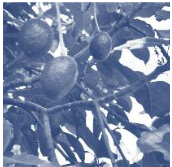
Zo groeien avocades