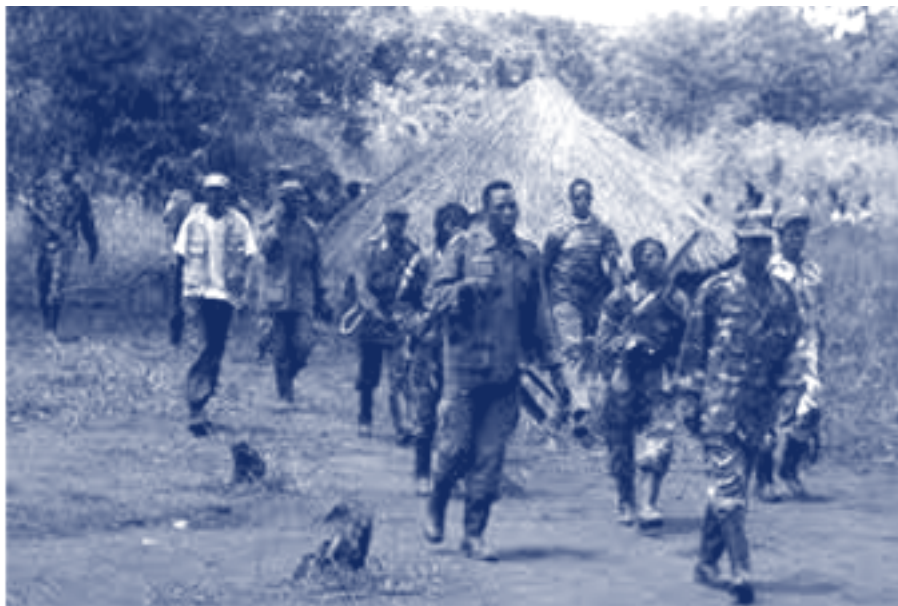
Het conflict tussen Hutu en Tuti's

Ook in Afrika, in dit geval Togo, maken mensen zich zorgen over het toenemende geweld in Afrika en elders in de wereld.