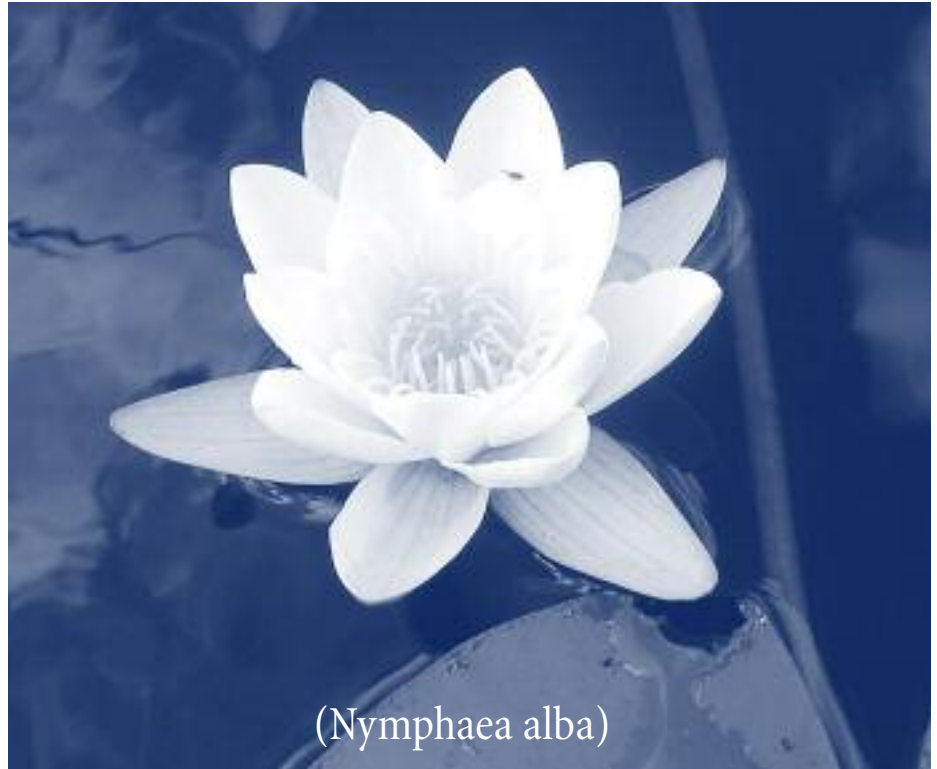
( Nymphaea alba )

Na onze lange reis door het Amazonegebied, de vorige maand, (op papier althans), wil ik deze maand wat dichterbij huis blijven. Er zijn twee meer algemene planten die net als de reuzenwaterlelie ( Victoria regia ) tot de familie van de Nymphaeaceaën behoren: de witte waterlelie en de gele plomp. De witte waterlelie ( Nymphaea alba ) heeft drijvende bloemen die een doorsnede kunnen hebben van 5,5 tot maar liefst 18 centimeter. De bloem- en bladstelen hebben vier grote luchtkanalen. De waterlelie groeit in vrij diep, stilstaand of zwak stromend water. In het laagveen komt de waterlelie algemeen voor, elders is ze zeldzaam. Door selectie en kruisingen zijn er plantenrassen ont-