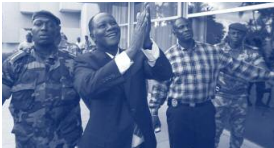
Het conflict in Ivoorkust. De nieuw gekozen President A.Ouattara