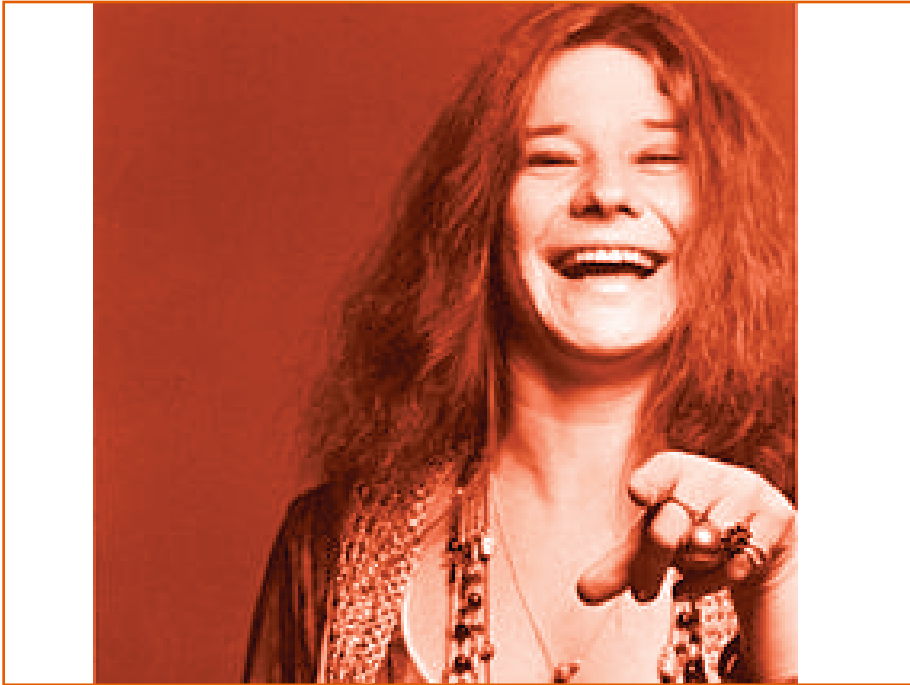
Janis lyn Joplin

Op de muziekrubriek van afgelopen maand kwamen veel reacties. Onder de lezers van Bulletin de Pijp zijn blijkbaar veel regelmatige - en vooral late - cafégangers, want suggesties voor goede uitsmijtlidjes kwamen in overvloed binnen.