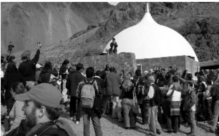
Silo Punta de Vacas (Argentinië) 4 mei, 2004

Peter Noordendorp: 020 6938005 / 0630103115of peternoordendorp@cs.com