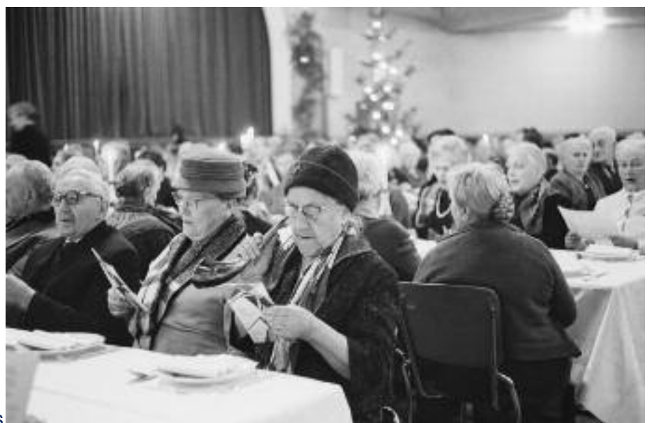
Kerstviering Leger des Heils

lesteerd. In Kampen waren er dagen achtereen ernstige ongeregelheden, zodat de staat van beleg moest worden afgekondigd. De koudste winter sinds mensenheugenis (1890) bracht de grote verandering in de publieke opinie. Het Leger opende zijn gebouw aan het Rapenburg voor mensen zonder onderdak, waar zij ook een ontbijt kregen. In 1893 werden in Nederland al bijna 100.000 overnachtingen geregistreerd en meer dan 800 maaltijden verstrekt. Ik ben wel eens in het pand aan de Gerard Doustraat geweest, omdat mijn zus daar een aantal jaar de leiding had van deze afdeling. Ze had de twijfelachtige eer om het ook te moeten sluiten. Veel buurtbewoners zullen zich nog wel herinneren dat op zondagavond het muziekkorps door de Pijp marcheerde voordat de dienst begon. En voor de nostalgisch ingestelden: op zaterdag 12 mei gebeurt dat nog een keer. Een band van het Leger des Heils marcheert dan 's middags vanaf het pand aan de Gerard Doustraat 69 richting Westergasfabriek waar op dat terrein het hele weekend festiviteiten plaatsvinden. Ik ga zeker kijken!