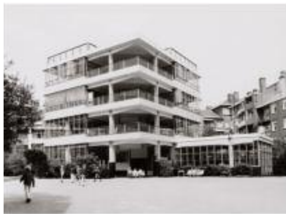
Afb.2 Eerste Openluchtschool in de Cliostraat 40, J. Duiker, 1929.

In de Pijp is er maar één gebouw van het Nieuwe Bouwen , niet verwonderlijk want de Pijp was immers klaar. Het is de voormalige Tempel van de Theosofische Vereniging in de Tolstraat. Later werd het de bioscoop Cinétoel, daarna een Openbare Bibliotheek en nu een zogenaamde 'culturele broedplaats'.