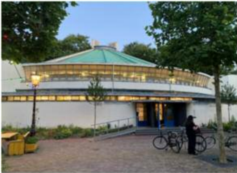
Afb.3 Tempel van de Theosofische Vereniging, 1925-'26, Tolstraat 160, architecten J.A. Brinkman en L.C. van der Vlugt.